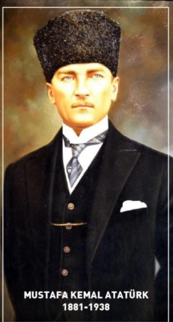
MUSTAFA KEMAL ATATÜRK 1881-1938